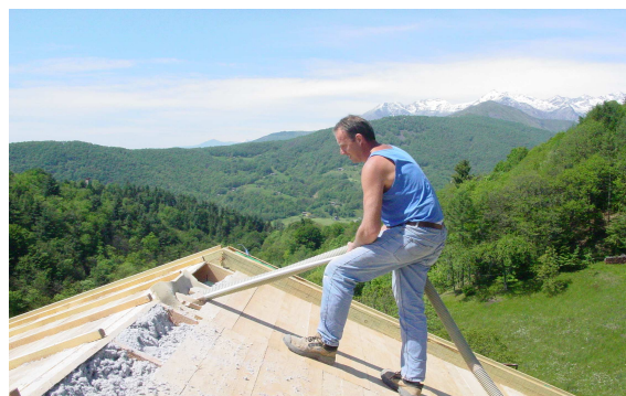
Posa del PACCHETTO ISOFLOC®